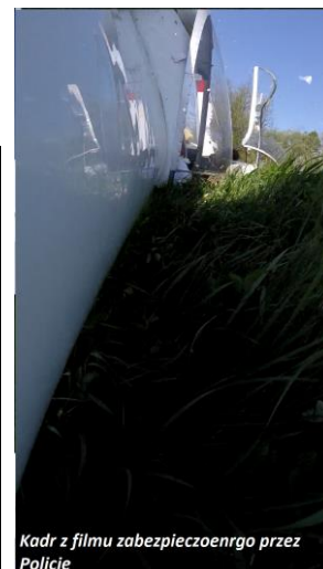
Kadr z filmu zabezpieczonego przez Policję