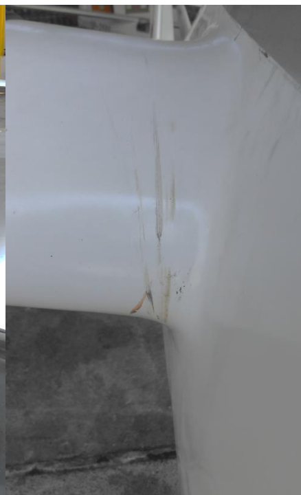
Rys. 2. Zarysowania kadłuba

Szybowiec wyposażony był w dolny zaczep z samowycze pem. Zgodnie z oświadczeniem instruktor nie wiedział, czy lina wycze piła się sama przy przechodzeniu do lotu ślizgowego, czy w momencie pociągnięcia za uchwyt wycze pu.