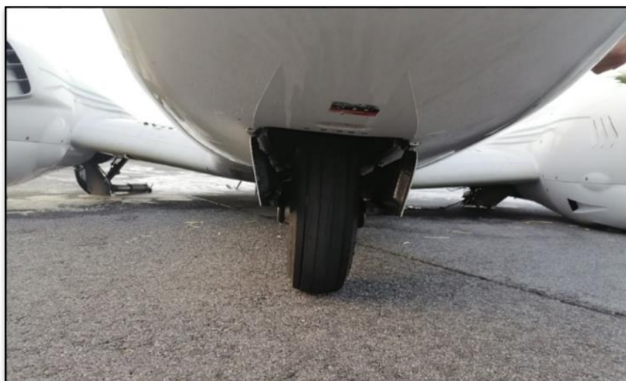
Rys. 3. Uszkodzone podwozie przednie