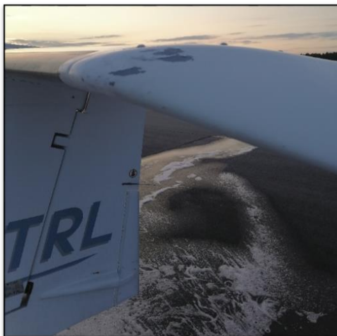
Rys. 7. Uszkodzenia usterzenia

W pobliżu wraku ujawniono rozrzucone liczne części (tuleje, śruby, elementy pokrycia) pochodzące głównie ze zniszczonego podwozia przedniego oraz uszkodzonych struktur kadłuba i skrzydeł.