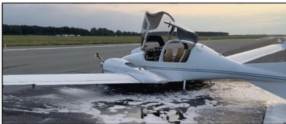
Rys.10. Położenie samolotu SP-TRL po zatrzymaniu i opuszczeniu przez załogę.

W trakcie oględzin miejsca zdarzenia w dniu 19 sierpnia 2021 r. Komisja ustaliła, że po uderzeniu statku powietrznego o nawierzchnię pasa startowego, samolot przemieścił się na odległość 268 metrów od miejsca przyziemienia, natomiast uszkodzone elementy konstrukcji płatowca, silnika oraz podwozia rozrzucone były na długości 336 metrów. Samolot przyziemił w połowie pasa startowego wzdłuż centralnej linii drogi startowej RWY26 a zakończył przemieszczanie się z odchyleniem około 45° od osi drogi startowej w kierunku na terminal lotniska (Rys.10).