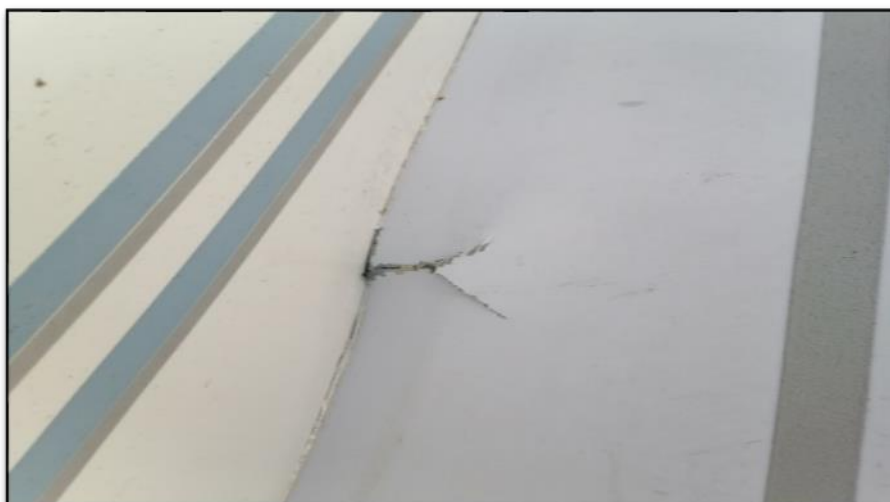
Rys. 6. Uszkodzenie płatowca na połączeniu skrzydła i kadłuba

Skrzydła samolotu nie oddzieliły się od kadłuba, natomiast uległy niewielkim uszkodzeniom w wielu miejscach. Pęknięcia i rozwarstwienia struktury skrzydeł powstały szczególnie na styku z kadłubem.