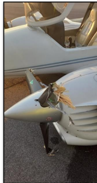
Rys. 4 i 5. Samolot SP-TRL ze zniszczonymi łopatami śmigieł prawego i lewego silnika.

Skrzydła samolotu nie oddzieliły się od kadłuba, natomiast uległy niewielkim uszkodzeniom w wielu miejscach. Pęknięcia i rozwarstwienia struktury skrzydeł powstały szczególnie na styku z kadłubem.