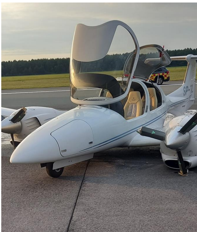
Rys.1. Samolot SP-TRL na lotnisku EPMO po twardym lądowaniu na pasie RWY 26

W ramach ćwiczenia wykonano 9 startów i lądowań, które przebiegały bez następstw. Po wykonaniu 9 lotu załoga SP zatrzymała samolot na pasie i po krótkiej przerwie wykonała ponowny start. W trakcie wznoszenia, na wysokości około 500ft 2 pilot-instruktor zredukował moc obu silników do zakresu obrotów minimalnych symulując awarię zespołu napędowego. W celu utrzymania prędkości lotu załoga SP rozpoczęła zniżanie z zamiarem lądowania na wprost 3 . Zniżanie wykonano ze znacznym pochyleniem maski samolotu do przodu i około godziny 16:05 samolot przyziemił z dużą prędkością pionową co doprowadziło do zniszczenia trójkołowego podwozia i trójłopatowych śmigieł obydwu silników oraz poważnych uszkodzeń płatu samolotu.