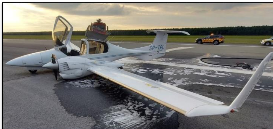
Rys. 2. Samolot SP-TRL na lotnisku EPMO po opuszczeniu przez załogę

W wyniku zdarzenia samolot uległ poważnym uszkodzeniom. Uszkodzone zostało podwozie samolotu, wyłamane golenie podwozia głównego i oddzielenie się kół od ich konstrukcji. Przednia goleń wraz z kołem została wgnieciona w komorę chowania przedniego podwozia.