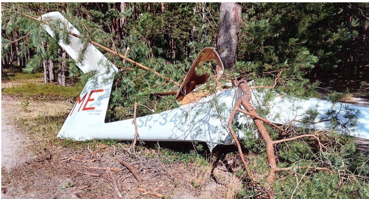
Rys. 4. Widok na uszkodzony szybowiec po zdarzeniu.

W trakcie zdarzenia szybowiec został znacznie uszkodzony (rys. 4).