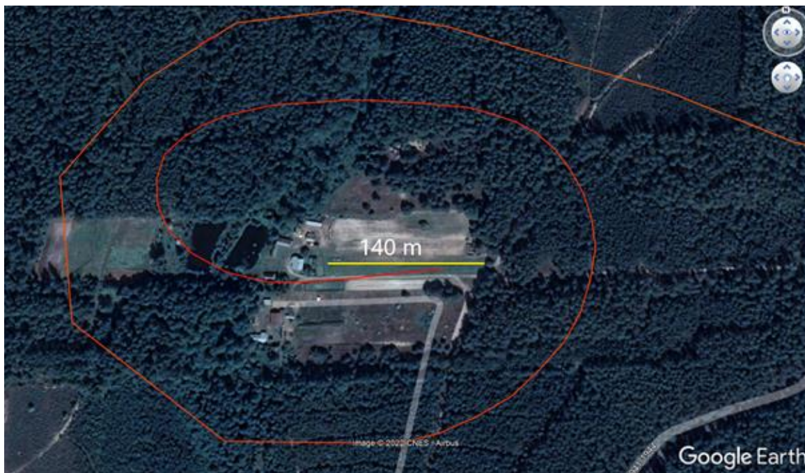
Rys. 2. Końcowa faza lotu szybowca