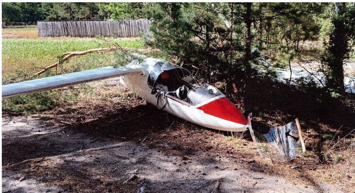
Rys. 3. Szybowiec po zdarzeniu