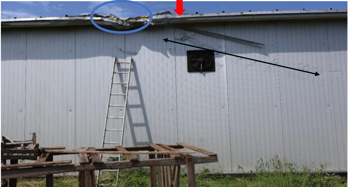
Rysunek 3. Miejsce uderzenia samolotu w budynek: główne uderzenie w krawędź dachu (niebieskie kółko), uderzenie prawego skrzydła (linia czarna), uderzenie przedniej części kadłuba (strzałka czerwona).

krawędzi (rys. 3). Uderzając w budynek na wysokości 3,75 m nad RWY, samolot był przechylony w prawo o około 20°, co spowodowało, że przednia część kadłuba uderzyła w powierzchnię dachu, prawe skrzydło w ścianę budynku, a główne uderzenie dolnej części kadłuba nastąpiło w krawędź dachu. Najmniejszemu uszkodzeniu uległo lewe skrzydło, które w chwili zderzenia znajdowało się nad powierzchnią dachu (rys. 4).