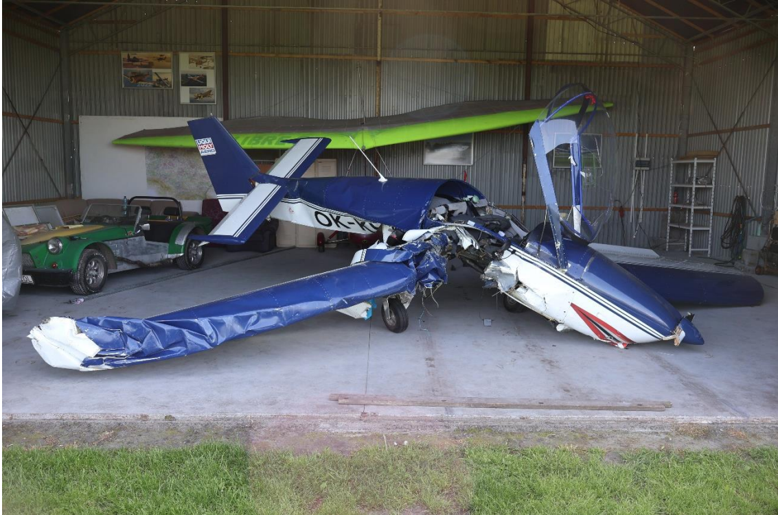
Rysunek 2. Wrak samolotu po przemieszczeniu do hangaru.

W wyniku wypadku samolot został zniszczony. Wszystkie uszkodzenia samolotu były skutkiem jego zderzenia z budynkiem gospodarczym. Wrak samolotu pokazano na rys. 2.