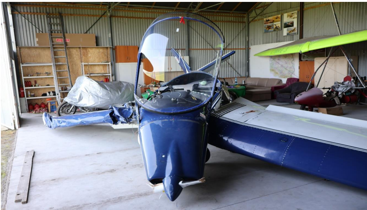
Rysunek 4. Widok uszkodzeń śmigła i lewego skrzydła samolotu.