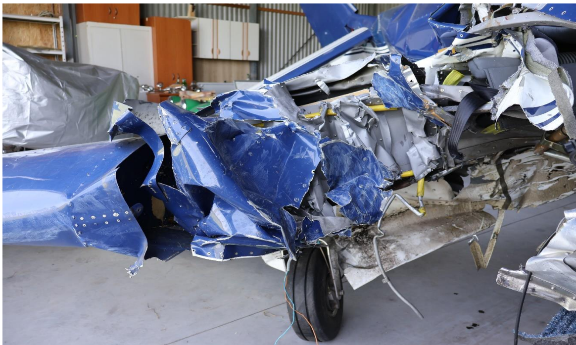
Rysunek 5. Uszkodzenia spowodowane uderzeniem samolotu w krawędź dachu.