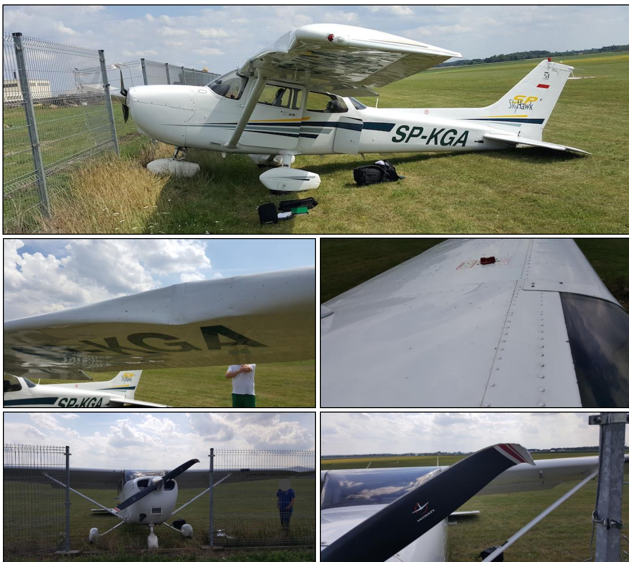
Rys.2÷6 Zdjęcia uszkodzonego samolotu Cessna 172 o znakach SP-KGA