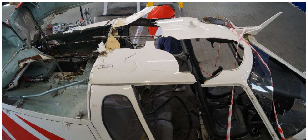
Rys. 3 Uszkodzony kadłub śmigłowca i miejsce po przekładni głównej.