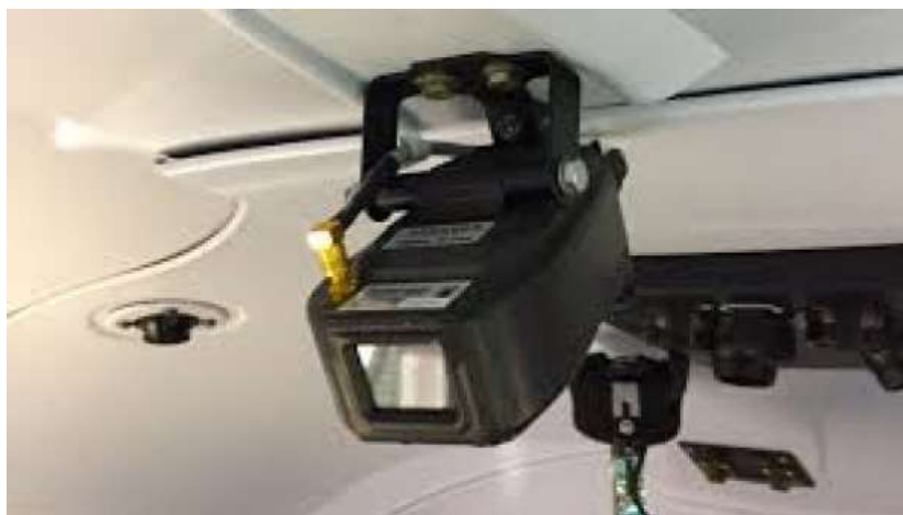
Rys. 6 Kamera APPAREO Vision 1000.

W opisie kamery producent zaznaczył, że posiada ona dwie niezależne pamięci: zewnętrzną oraz wewnętrzną. Zewnętrzna pamięć wykonana została jako odporna na skutki wypadku i może stanowić pierwsze źródło informacji podczas badania zdarzeń - zawiera ostatnie 2 h obrazu i dźwięku z kamery, a także dane o pozycji statku powietrznego podczas ostatnich 200 h. Próbkiwanie następuje co 0,25 s.