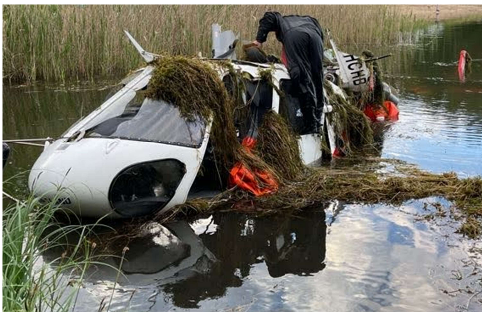
Rys. 2 Wrak śmigłowca podczas wydobywania na brzeg jeziora. Zwraca uwagę brak wirnika oraz oddzielona przekładnia główna.

Struktura podłogi, siedzeń oraz ich mocowania w kabine nie zostały naruszone.