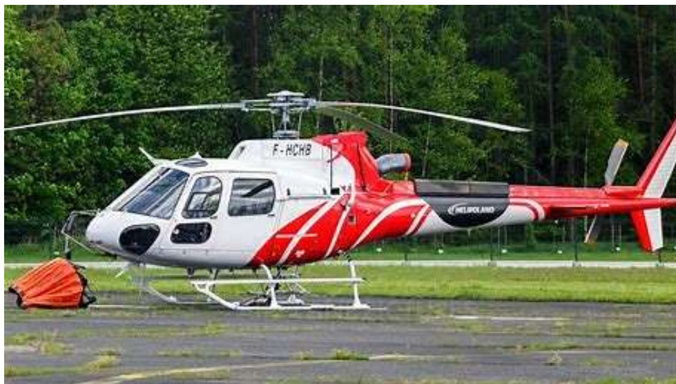
Rys. 4 Śmigłowiec AS350B3e oraz zasobnik typu bambi bucket do transportowania wody