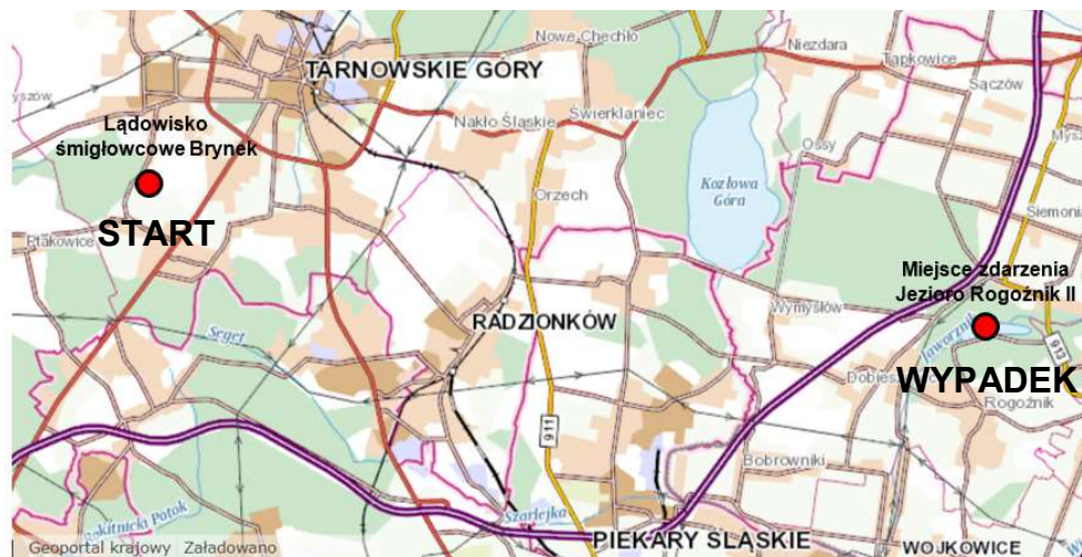
Rys. 8 Miejsce startu oraz wypadku [źródło: Geoportal]