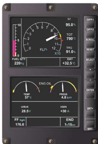
Rys. 7 VEMD

VEMD jest zainstalowany w centralnej części tablicy przyrządów (Rys. 7). Prezentuje on graficznie główne parametry śmigłowca oraz silnika. VEMD składa się ze zdublowanego modułu procesowania danych oraz modułu wyświetlania danych, zawierającego podwójny wyświetlacz.