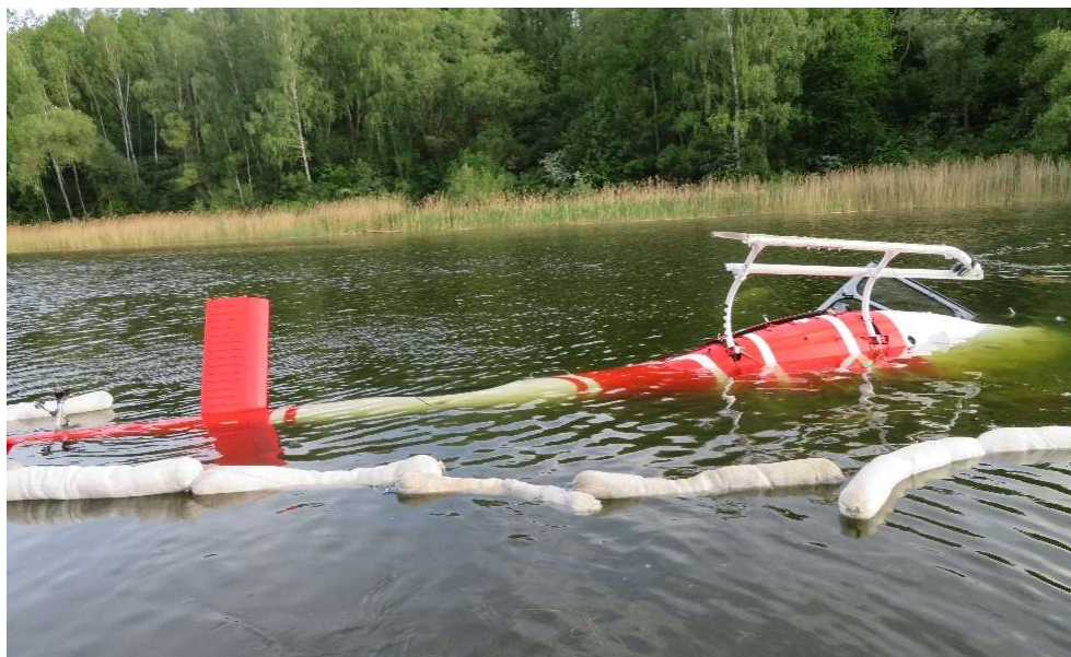
Rys. 1 Miejsce wypadku - zanurzony w jeziorze śmigłowiec AS350B3e oraz białe rękawy absorpcyjne, mające wychwytywać zanieczyszczenia.

Wydobycie wraku z jeziora nastąpiło po około 3 dobach od wypadku. Do chwili wydobycia obszar, w którym znajdował się wrak, był zabezpieczony przez PSP oraz policję.