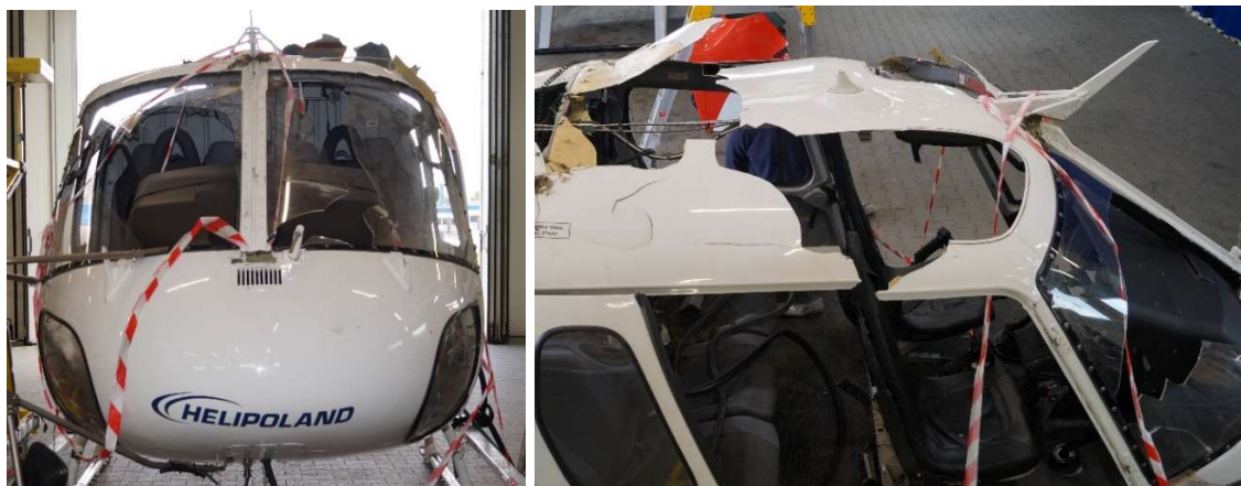
Rys. 9 Zewnętrzne uszkodzenia kokpitu: wyrwy w dachu oraz brakujące duże fragmenty oszklenia. Brak prawych drzwi spowodowany jest zrzuconiem ich podczas ewakuacji.

Z powodu uszkodzenia anteny zewnętrznej nadajnika ratunkowego ELT w trakcie wypadku, sygnał emitowany przez nadajnik nie był transmitowany.